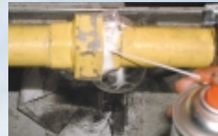
Gefahr: undichte Gasleitung