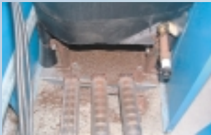
Gefahr: stark verschmutzter/ verrosteter Gasbrenner